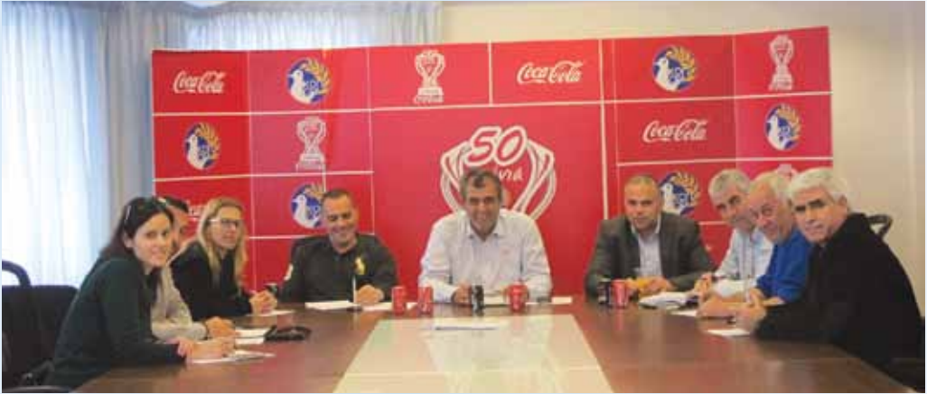
Στιγμιότυπο από την καθιερωμένη σύσκεψη που πραγματοποιήθηκε στα γραφεία της ΚΟΠ.