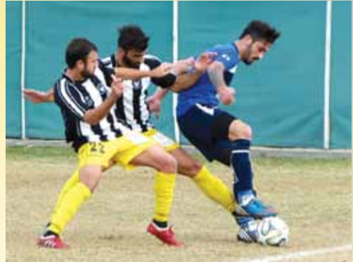
Στιγμιότυπο από παιχνίδι της ΠΑΕΕΚ με τον Εθνικό Λασιών.