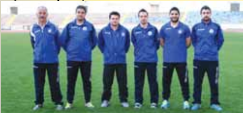
Η προπονητική ομάδα της ΠΑΕΕΚ πριν από την προπόνηση στο Μακάρειο.